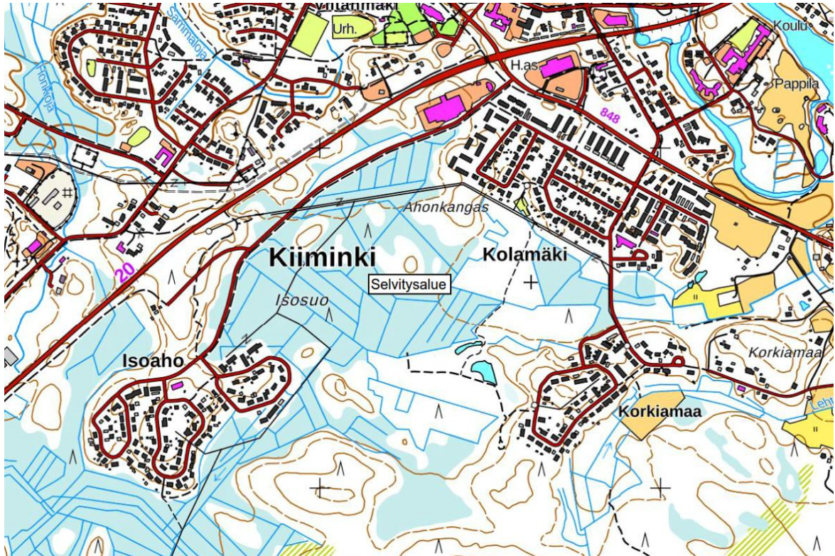
Kuva 1 Selvitysalueen ohjeellinen sijainti, paikkatietoikkuna MML

Kaavamuuotosalueelle on tulossa asuin- ja palvelualueita. Alueella muodostuu enemmän hulevesiä nykyisen tilanteen verrattuna, koska vettä läpäisemättömien pintojen pinta-ala lisääntyy.