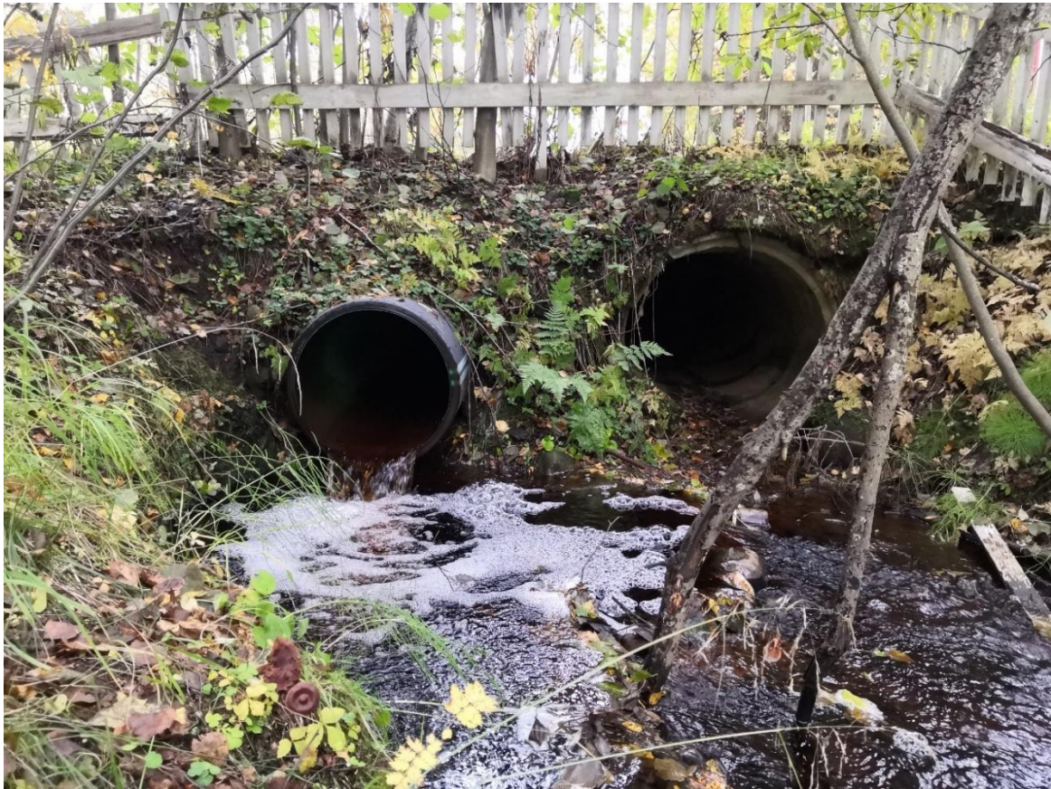
Kuva 2 Yksityisen kiinteistön ali menevän rummun purkupää kiinteistön pohjoispuolella.